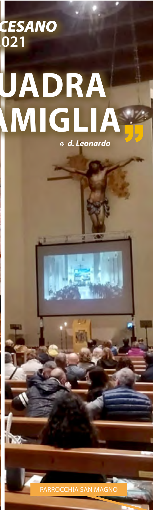
PARROCCHIA SAN MAGNO