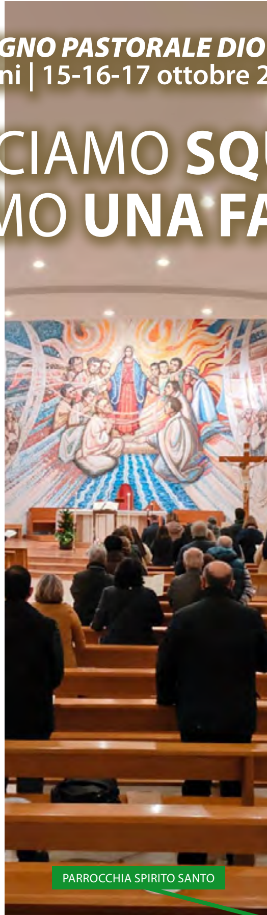
PARROCCHIA SPIRITO SANTO